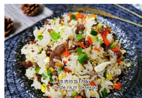
12. Stegte ris med oksekød