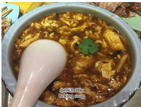
1. Peking soup

(IKKE TIL TAKE AWAY, KUN SPIS I RESTAURANT.)