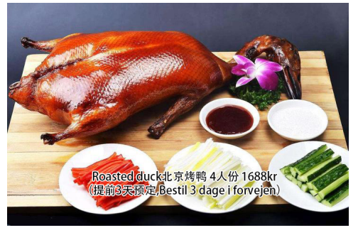
24. Roasted duck