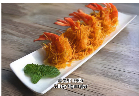
6. Crispy tigerrejer