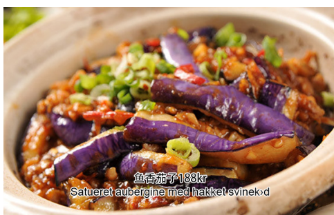
13. Satueret aubergine med hakket svinekød