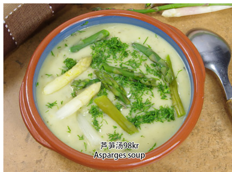
3. Asparagus soup