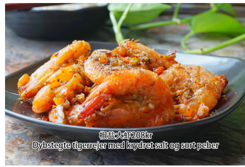
19. Dybstegte tigerrejer med krydret salt og sort peber