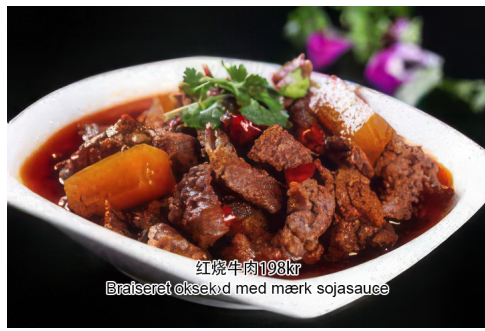
18. Braiseret oksekød med mørk sojasauce