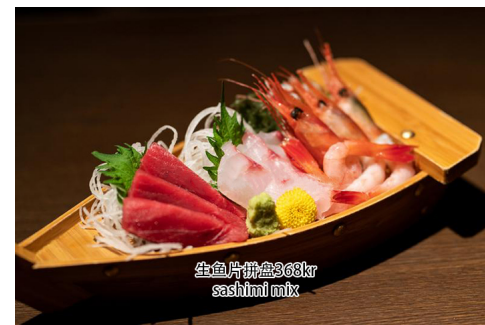
4. Sashimi mix