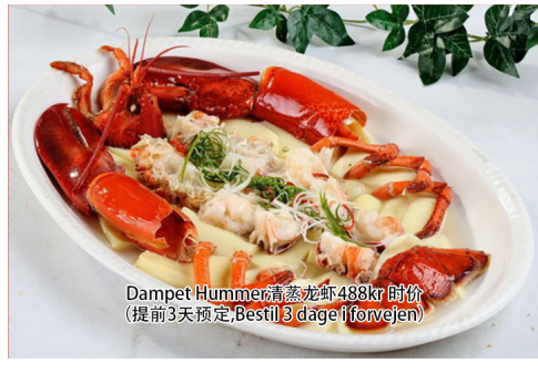
22. Dampet Hummer