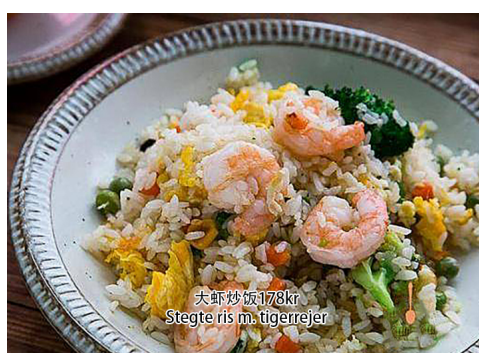
11. Stegte ris med tigerrejer