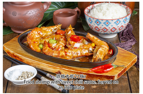
20. Fried shrimp with sweet chili sauce. Served on an iron plate