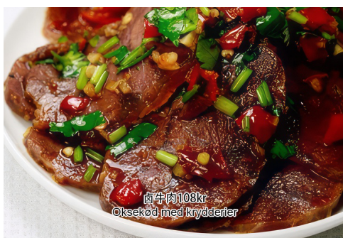
5. Oksekød med krydderier