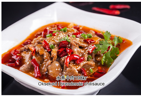
17. Oksekød I brændende chilisaucе