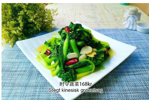
14. Stegt kinesisk grøntsag