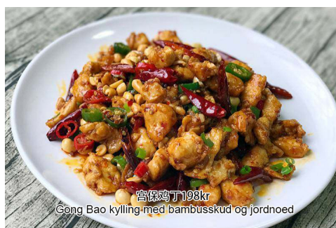
15. Gong Bao kylling med bambusskud og jordnød