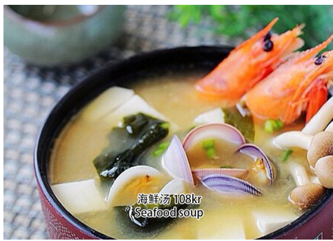
2. Seafood soup