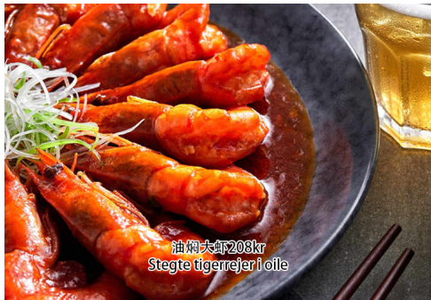
21. Stegte rejer