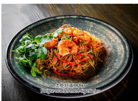
9. Stegte nudler med tigerrejer