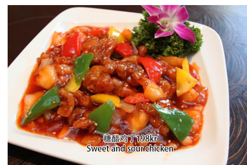
16. Sweet and sour chicken