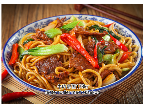
10. Stegte nudler med oksekød